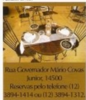
Rua Governador Mário Covas Junior, 14500 Reservas pelo telefone (12) 3894-1414 ou (12) 3894-1312.

Na Pousada Solar Singuita ainda é possível realizar toda uma programação especial. Depois de curtir uma relaxante massagem no SPA da pousada, o cliente pode desfrutar das iguarias gastronômicas do restaurante.